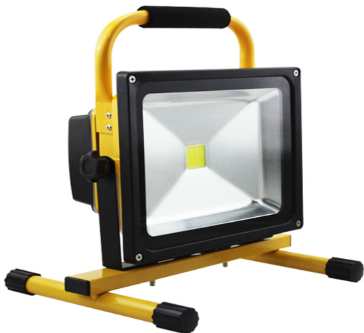
LED0321 REFLECTOR RECARGABLE 20W 6500K A